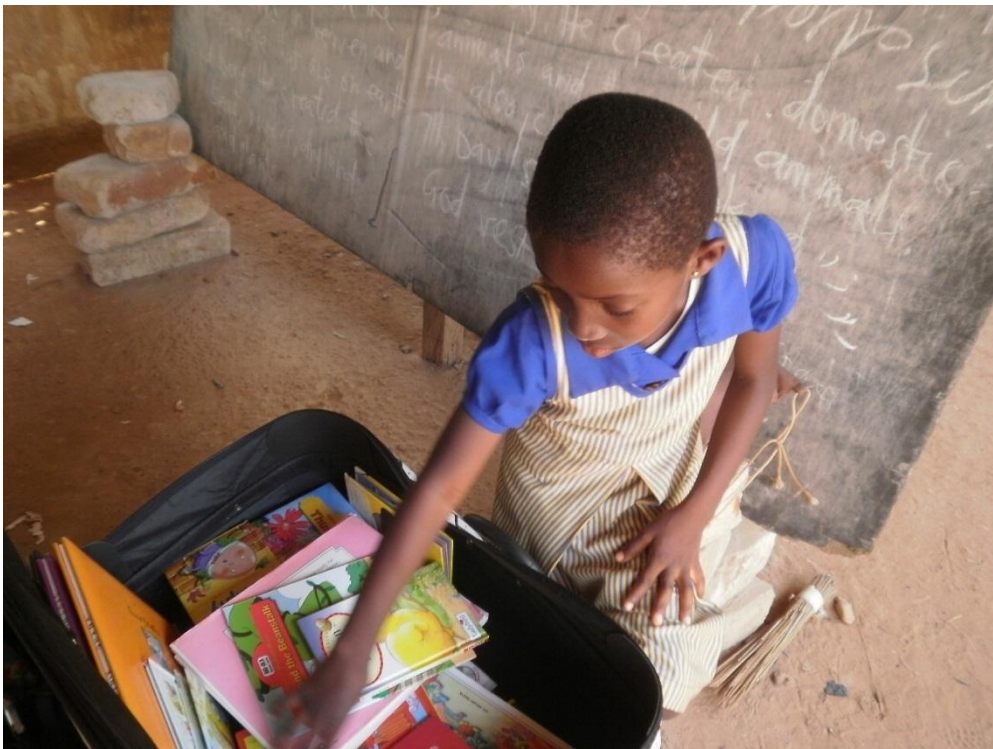
初日の様子(ブルーのシャツの女の子は、本を整理してくれています)